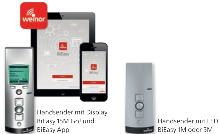
Handsender mit Display BiEasy 15M Go! und BiEasy App

Mit den Infrarot-Heizungen Tempura und Tempura Quadra können Sie Ihre Terrasse abends länger nutzen – auch in kühleren Jahreszeiten. Sie bringen angenehme Sofortwärme ganz ohne Vorheizen. Tempura und Tempura Quadra sind dimmbar, energieeffizient und leicht zu bedienen.